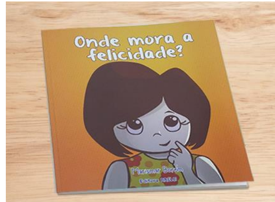
Onde Mora a Felicidade Autora: Marismar Borem Editora: Portal do Logosófico