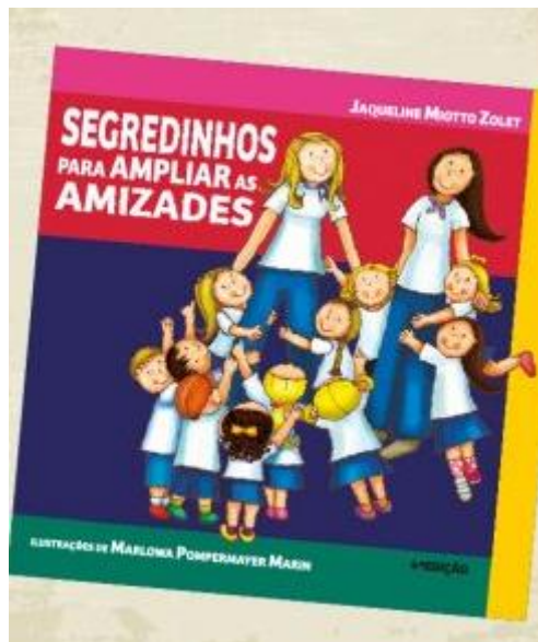
Segredinhos para ampliar as amizades Autora: Jaqueline Miotto Zolet Editora: Portal do Logosófico