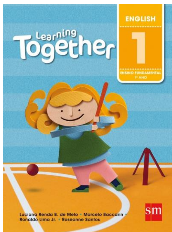
Learning Together 1