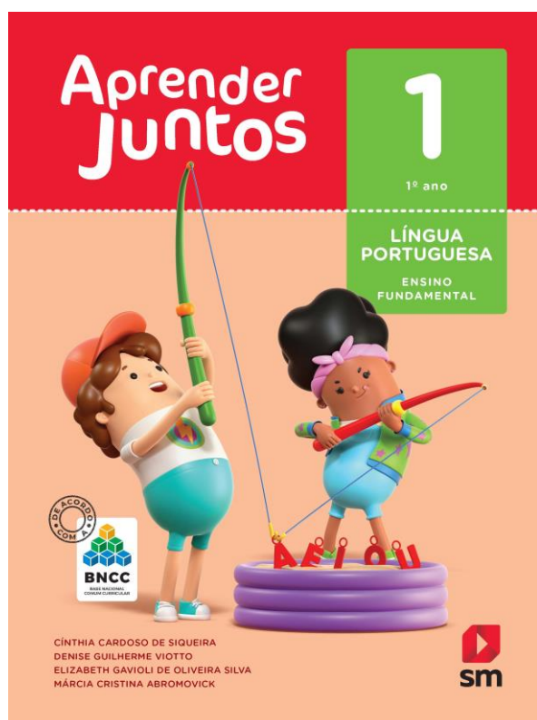
Aprender Juntos – Língua Portuguesa 1

Livros: As Editoras venderão os livros (com desconto) em 06/02, na primeira reunião de pais.