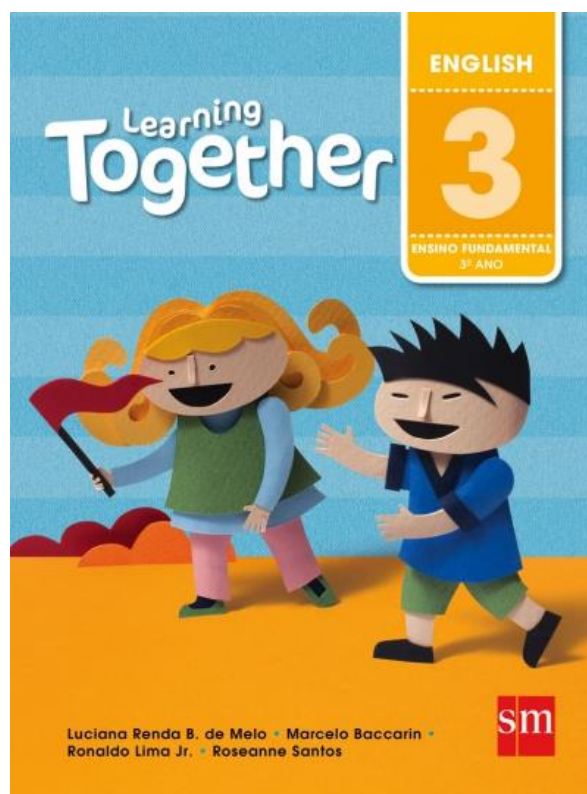
Learning Together 3