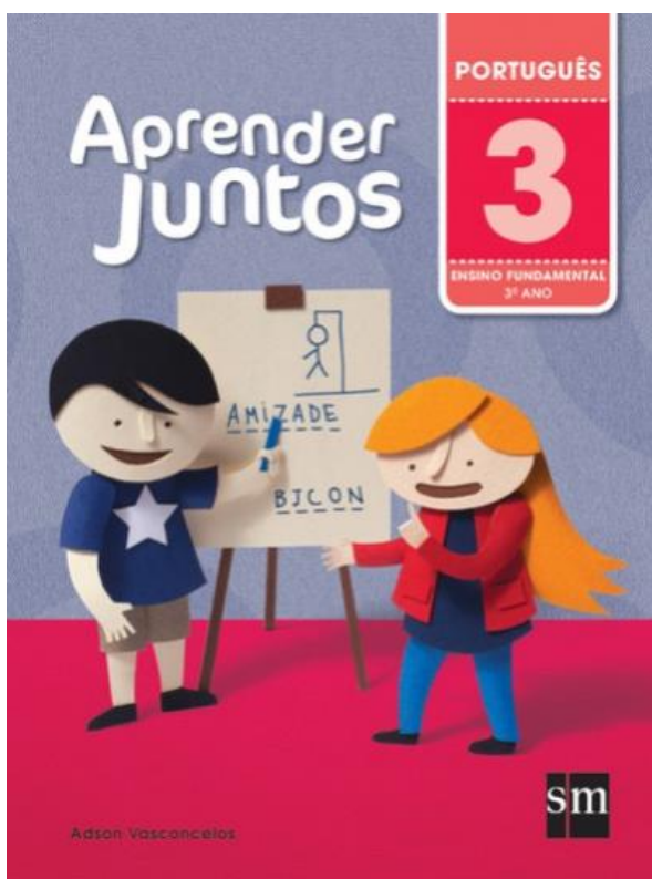
Aprender Juntos – Português 3