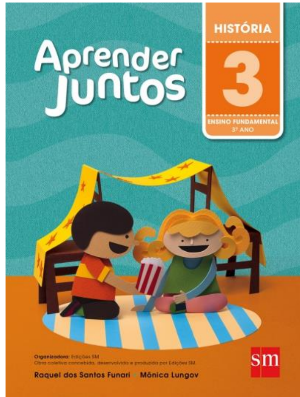
Aprender Juntos – História 3 Autoras: Raquel dos Santos Funari e Mônica Lungov Editora: SM