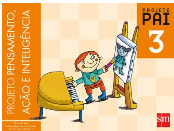
Projeto Pensamento Ação e Inteligência - 3 Autora: Marian Baqués Editora: SM