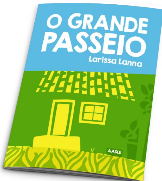
O Grande Passeio Autora: Larissa Lanna Editora: Portal do Logosófico