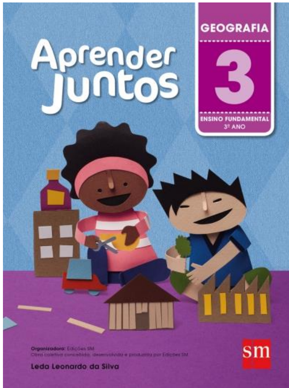
Aprender Juntos – Geografia 3 Autora: Leda Leonardo da Silva Editora: SM