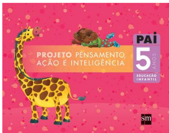
Projeto PAI 5 Anos Autora: Marian Baqués Editora: SM

A Editora SM venderá diretamente aos pais os livros com desconto no dia 05/02/18 – Reunião de Pais